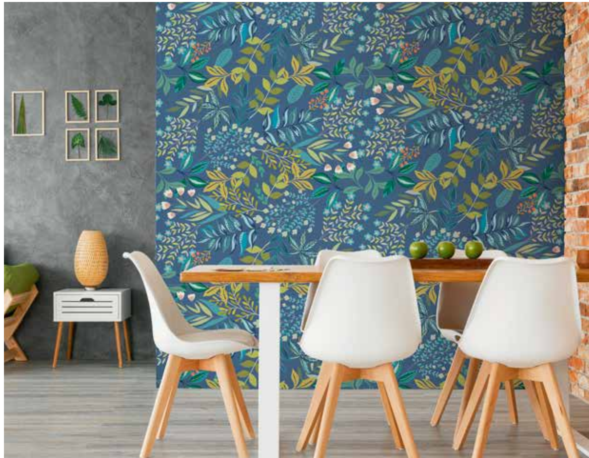
RIVESTIMENTO . WALL: Majorelle 60x120 . 24"x48", 9 mm - Rettificato . Rectified PAVIMENTO . FLOOR: Warm Style - Woodbreak, Hemlock 20x160 . 8"x63", 9 mm - Rettificato . Rectified

Stilisierte Blüten und Blätter ergeben im Format 60x120 lebendige Dekorationen. Die präzisen Verbindungen der Grafiken bereichern die zeitgenössische Umgebung mit Charme und Kreativität, um eine angenehme und einnehmende ästhetische Wirkung zu erzielen.