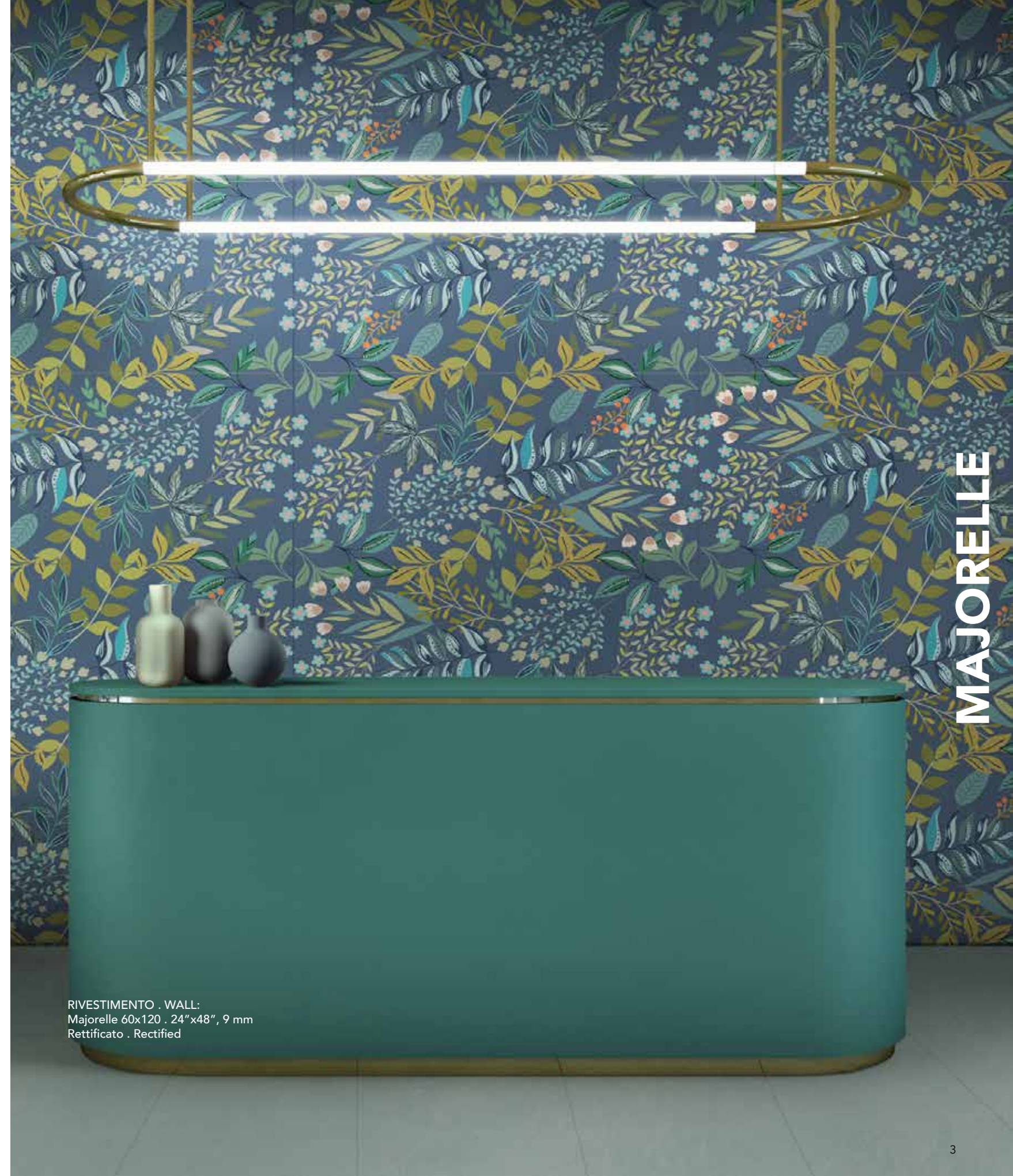
RIVESTIMENTO . WALL: Majorelle 60x120 . 24"x48", 9 mm Rettificato . Rectified